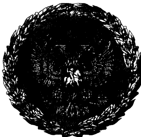
РИСУНОК НАГРУДНОГО ЗНАКА К ПОЧЕТНОЙ ГРАМОТЕ ПРЕЗИДЕНТА РОССИЙСКОЙ ФЕДЕРАЦИИ

Утвержден Указом Президента Российской Федерации от 11 апреля 2008 г. N 487